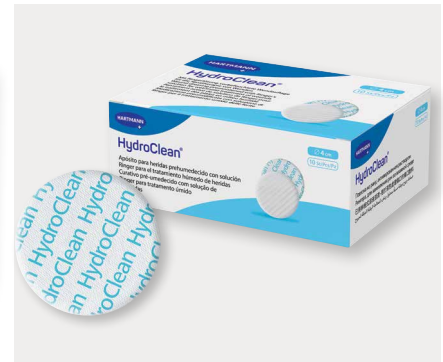
Figura 8: Os HRWD retêm níveis excessivos de inibidores da cicatrização (por exemplo, proteases e bactérias) e libertam solução de Ringer na ferida, facilitando a limpeza, amolecendo o tecido necrótico e a fibrina, e permitindo o desbridamento autolítico.