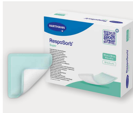
Figura 7: Os pensos superabsorventes promovem absorção e retenção eficazes em feridas com exsudação intensa, prevenindo o extravasamento e a passagem de exsudado para o exterior.