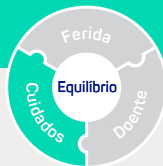
Figura 2: As três categorias de barreiras para alcançar a cicatrização de feridas e a melhoria nos resultados do doente.