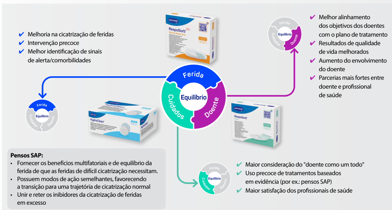
Figura 9: Benefícios da implementação do Equilíbrio da Ferida (WUWHs, 2025).

[Figura 9], o conceito de Equilíbrio da Ferida auxilia os profissionais de saúde a alinhar os objetivos dos doentes com as necessidades clínicas (por exemplo, redução do tecido necrótico, da biocarga e/ou da inflamação) e demonstrou melhorar os resultados dos doentes em todas as etiologias de feridas e em todos os contextos clínicos (WUWHs, 2025).