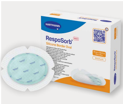
Figura 6: Os pensos SAP de silicone mantêm um nível adequado de humidade no microclima da ferida, previnem a maceração e danos ao tecido perilesional, além de absorverem e reterem os inibidores da cicatrização através do seu mecanismo de ação.