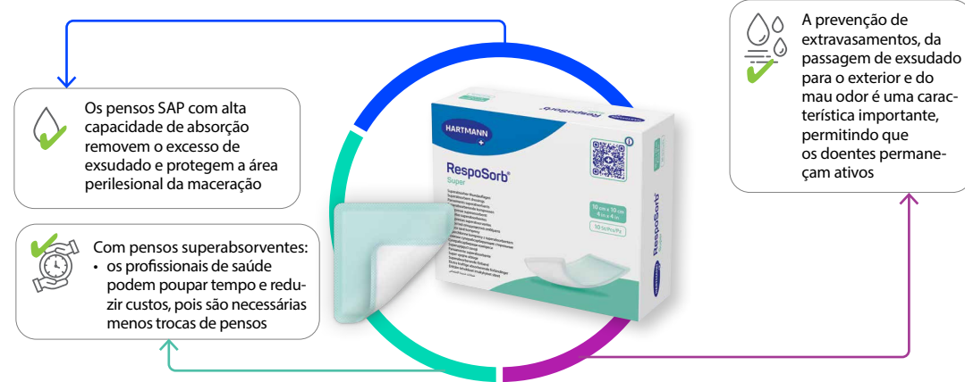
Figura 4: Recomendações para o RespoSorb® Super

O RespoSorb® Super é recomendado para a gestão do exsudado