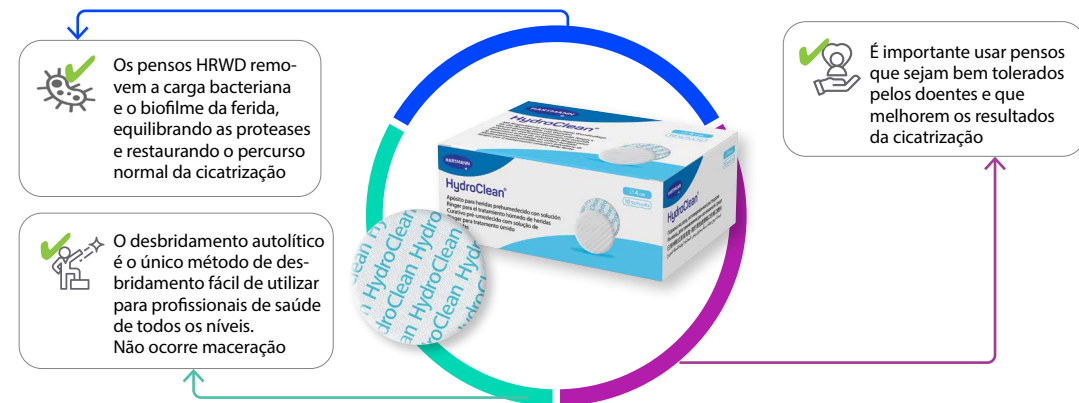
Figura 5: Recomendações para o HydroClean®

O HydroClean® é recomendado para desbridamento