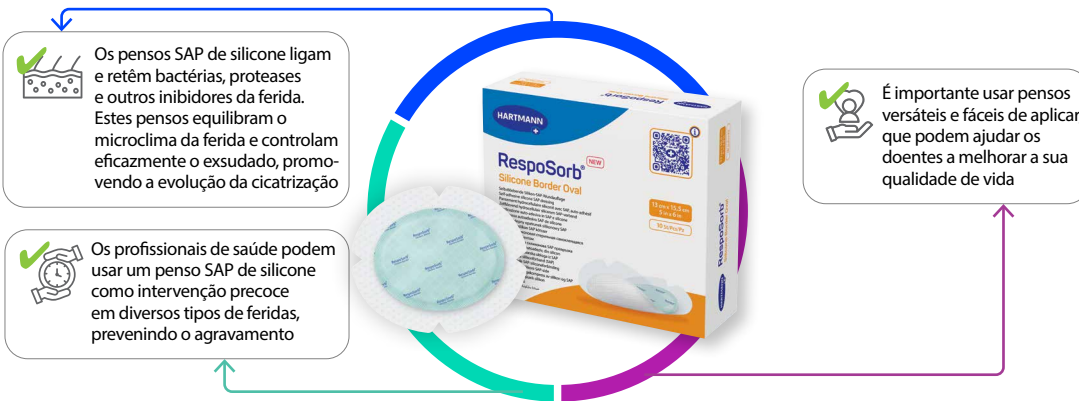
Figura 3: Recomendações para o RespoSorb® Silicone Border

O RespoSorb® Silicone Border é recomendado pelos especialistas da WUWHS como tratamento de primeira linha na intervenção precoce em feridas.