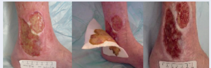
Abbildung 1: Praxisfallstudie mit dem BIOSORB-Verband (Ivins und Harding, 2017)

In zwei weiteren Fallstudien (Braumann et al., 2017) wurde über Erfahrungen mit dem BIOSORB-Verband in der täglichen klinischen Praxis für die Behandlung von Wunden mit mäßigem bis starkem Exsudat berichtet. Hier wurde berichtet, dass der BIOSORB-Verband Flüssigkeiten schnell absorbiert, sehr stabil und leicht anpassbar ist und in einem Stück ohne Rückstände im Wundbett entfernt werden kann ( n = 2 ). Nach vierwöchiger Behandlung war die Heilung aller mit dem BIOSORB-Verband behandelten Wunden fortgeschritten. Die Fähigkeit des BIOSORB-Verbands, Wundflüssigkeiten zu absorbieren, unterstützt die Aufrechterhaltung einer optimalen Umgebung für die Wundheilung, was dem autolytischen Debridement und dem Wundheilungsprozess förderlich ist.