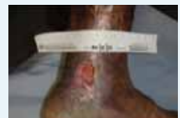
Abb. 2: Ulcus cruris nach einer zweiwöchigen Behandlung mit einem Protease-modulierenden Verband