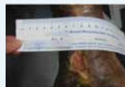
Abb. 1: Ulcus cruris bei Behandlungsbeginn