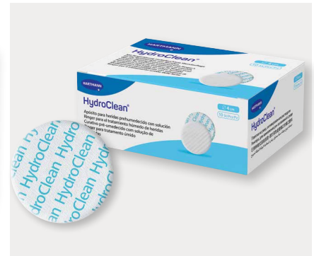
Figura 8: Os HRWD retêm níveis excessivos de inibidores da cicatrização (por exemplo, proteases e bactérias) e libertam solução de Ringer na ferida, facilitando a limpeza, amolecendo o tecido necrótico e a fibrina, e permitindo o desbridamento autolítico.