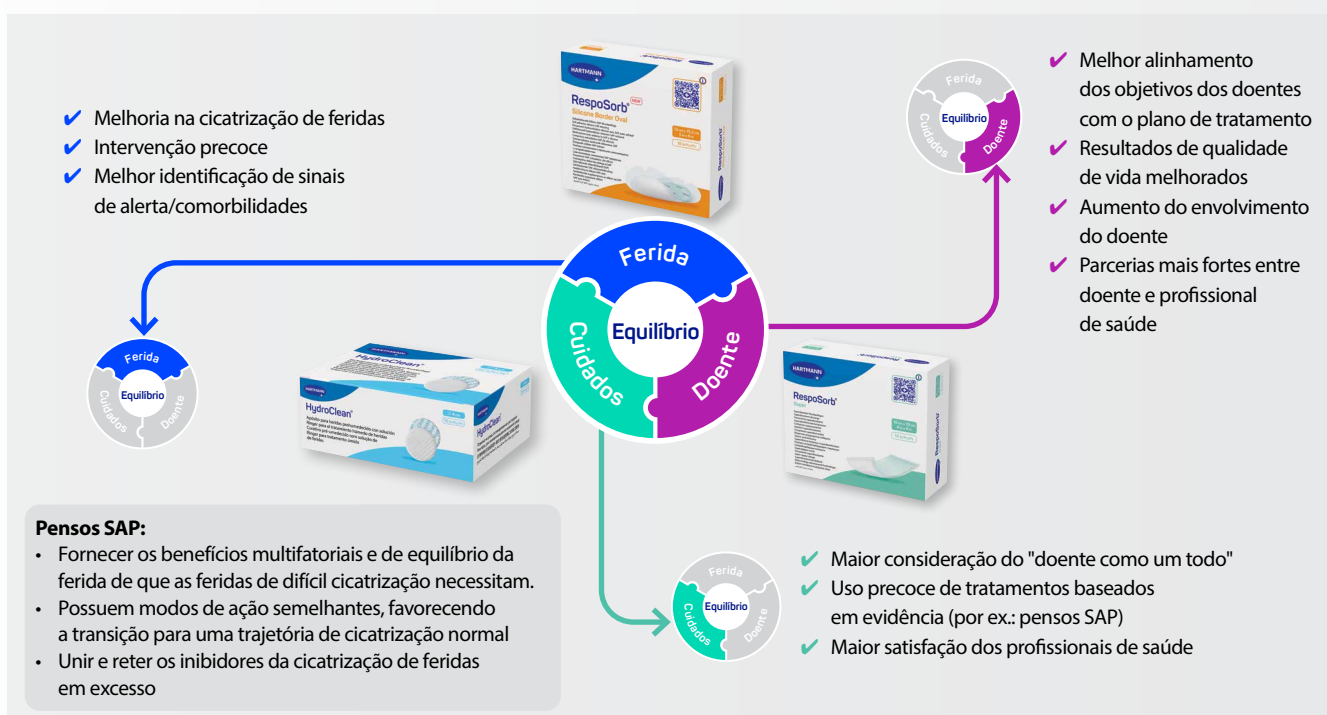
Figura 9: Benefícios da implementação do Equilíbrio da Ferida (WUWHS, 2025).

[Figura 9], o conceito de Equilíbrio da Ferida auxilia os profissionais de saúde a alinhar os objetivos dos doentes com as necessidades clínicas (por exemplo, redução do tecido necrótico, da biocarga e/ou da inflamação) e demonstrou melhorar os resultados dos doentes em todas as etiologias de feridas e em todos os contextos clínicos (WUWHS, 2025).