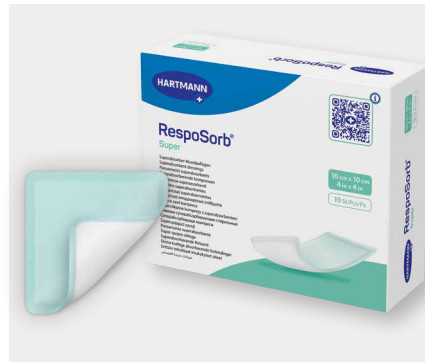
Figura 7: Os pensos superabsorventes promovem absorção e retenção eficazes em feridas com exsudação intensa, prevenindo o extravasamento e a passagem de exsudado para o exterior.