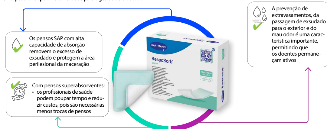
Figura 4: Recomendações para o RespoSorb® Super

O RespoSorb® Super é recomendado para a gestão do exsudado