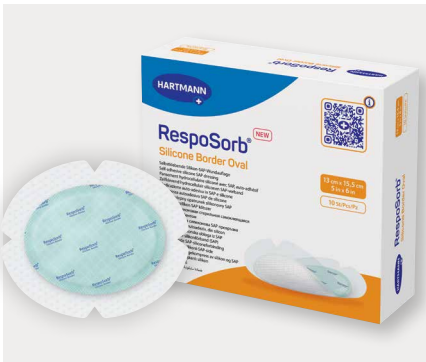
Figura 6: Os pensos SAP de silicone mantêm um nível adequado de humidade no microclima da ferida, previnem a maceração e danos ao tecido perilesional, além de absorverem e reterem os inibidores da cicatrização através do seu mecanismo de ação.