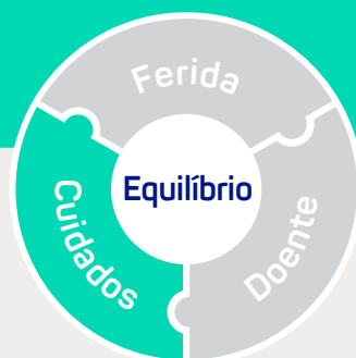
Figura 2: As três categorias de barreiras para alcançar a cicatrização de feridas e a melhoria nos resultados do doente.