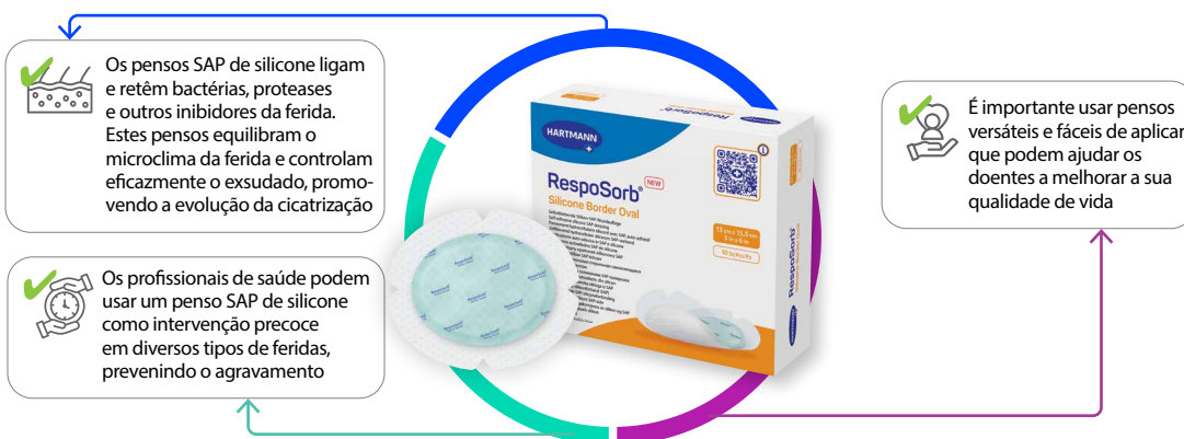
Figura 3: Recomendações para o RespoSorb® Silicone Border

O RespoSorb® Silicone Border é recomendado pelos especialistas da WUWHS como tratamento de primeira linha na intervenção precoce em feridas.