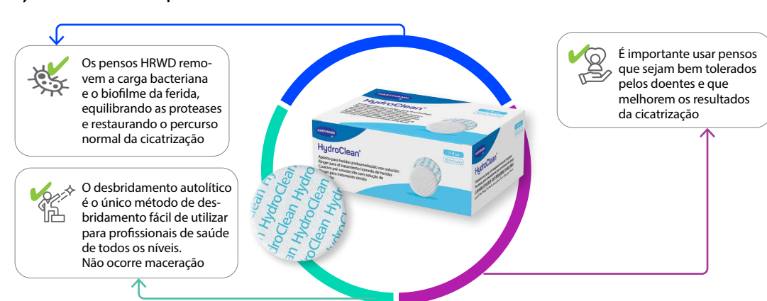
Figura 5: Recomendações para o HydroClean®

O HydroClean® é recomendado para desbridamento